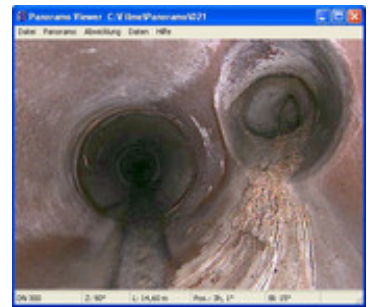
PANORAMO Viewer, PANALYSE

In dieser Darstellung sind unterschiedliche Messungen möglich.