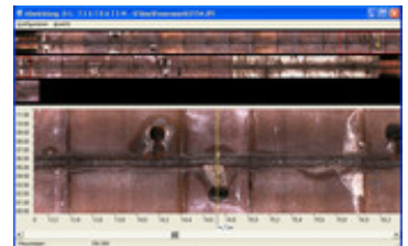
PANORAMO Viewer, Abwicklung