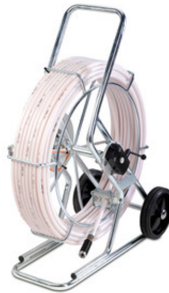
IBAK HSP 60