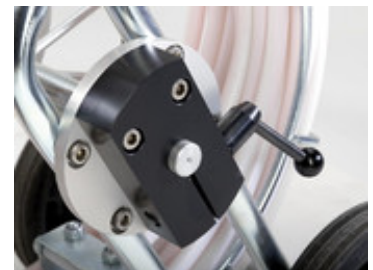
IBAK HSP Feststellbremse