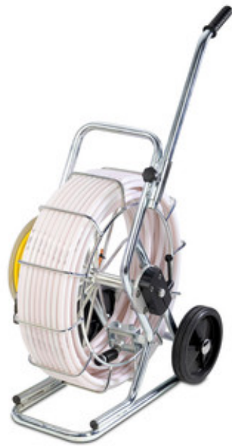
IBAK HSP 40