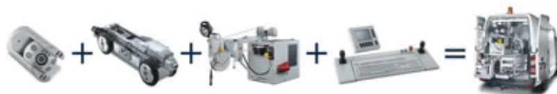
Beispiel: ARGUS 5 + KRA 85 + KW 505 + BS 5