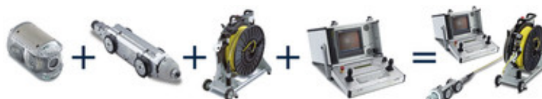
Beispiel: Orion + KRA 65 + KT180 + BK3