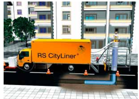
Die von der RS Technik AG angebotenen Schlauchlining-Systeme erlauben die Sanierung von Abwasserleitungen und -kanälen im Dimensionsbereich von DN 80 bis DN 1400.

Installationstechnik, ein darauf abgestimmtes hochwertiges Material, sowie eine umfassende Unterstützung und Beratung angeboten. Die Sanierungstechniken werden ständig weiterentwickelt und neuen Erkenntnissen und Er-