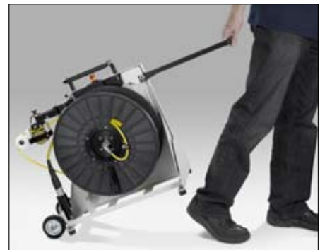
▲ IBAK KT 180, Transportgriff

▼ IBAK KT 180 mit Verlängerungskabel VT 50 zur Vergrößerung des Aktionsradius. VT 50 ist als Zubehörteil erhältlich.