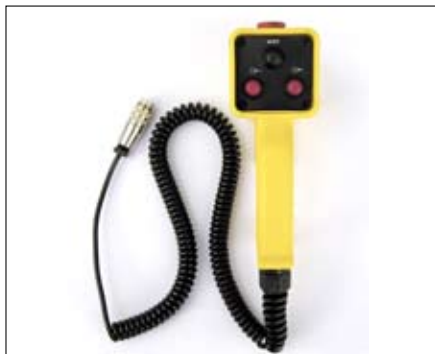
▲ Fernbedienung für IBAK KT 180