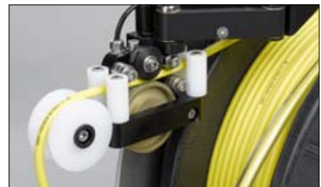
▲ IBAK KT 180, verstellbare Kabelführung