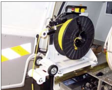
▲ Fahrzeug-Einbausatz für IBAK KT 180