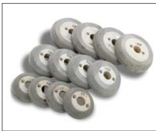
Granulatradsätze für höchsten Vortrieb