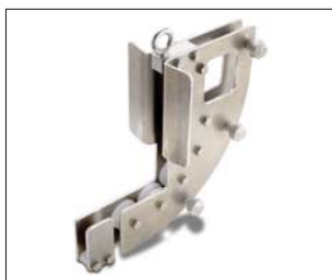
Kabelumlenkvorrichtung zum Umlenken des Kamerakabels am Übergang vom Schacht zum Hauptkanal