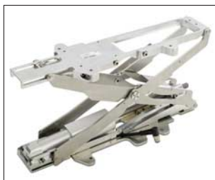
Elektrische Höhenverstellung zur Kamerapositionierung