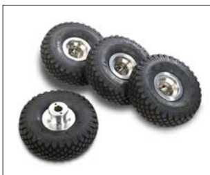
Luftreifen für Kanalrohrinspektion ab DN 300