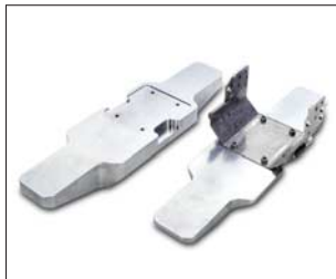
Zusatzgewichte zur Gewichtserhöhung des Kamerarohrantriebs