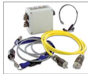
Verlängerungsanlage / Extension-Kit