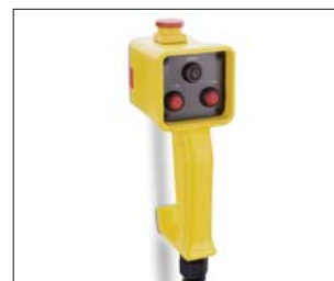
Fernbedienung für Kabeltrommel und -Winde