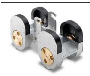
Fahrwagenzusatz für KRA65 zur Kanalrohrinspektion ab DN 300