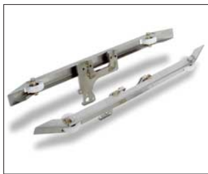
Eiprofilzusatz zur Untersuchung von Rohrleitungen mit Eiprofil