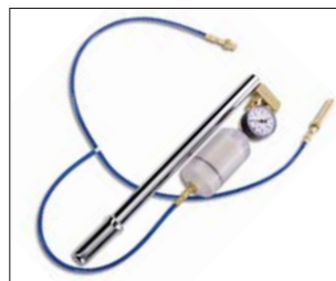
Druckprüfhilfe mit Manometer und Lufttrockner