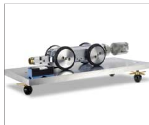
Neigemessungs-Erweiterung mit Justiervorrichtung