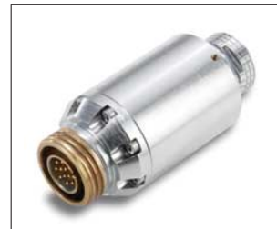
Adapterstecker zur direkten Verbindung von Kamera und Kamerakabel