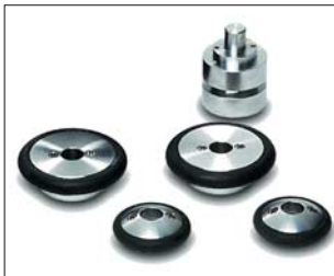
Unterschiedlichste Radsätze für Kanalrohrinspektion ab DN 100