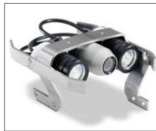
Zusatzscheinwerfer und Kontrollkamera für LISY-System