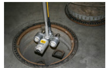
IBAK ORPHEUS und Schachtadapter