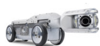
IBAK ORPHEUS am KRA 75