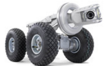
IBAK ORPHEUS am KRA 75 mit ZSW und Traktorreifen