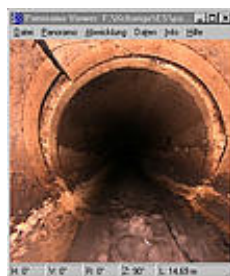
zweidimensionale Abwicklung perspektivische Sicht