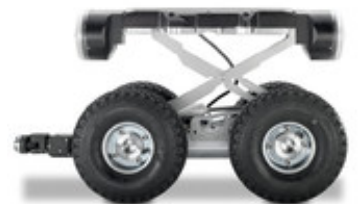
IBAK PANORAMO 3D Kugelbildscanner mit Luftreifen und Höhenverstellung