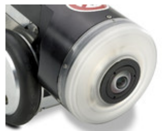
IBAK PANORAMO 3D Kugelbildscanner Objektiv und Xenon Blitzbeleuchtung