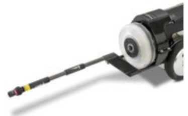
IBAK PANORAMO 3D Kugelbildscanner mit IBAK Laser Profiler