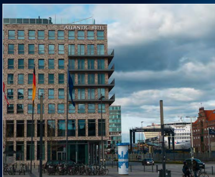
ATLANTIC Hotel Kiel Raiffeisenstraße 2 · 24103 Kiel Fon: 0431-374 99 555 · Fax: 0431-374 99 500 www.atlantic-hotels.de reservierung.ahk@atlantic-hotels.de