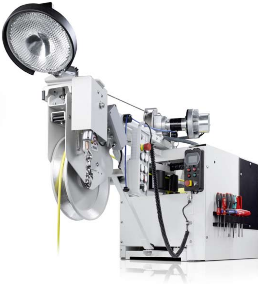
IBAK KW 305