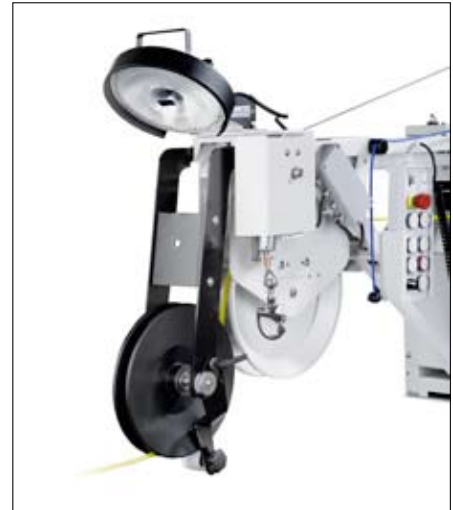
▲ IBAK KW 305/505, Kabelumlenkvorrichtung für schwer zugängliche Schächte