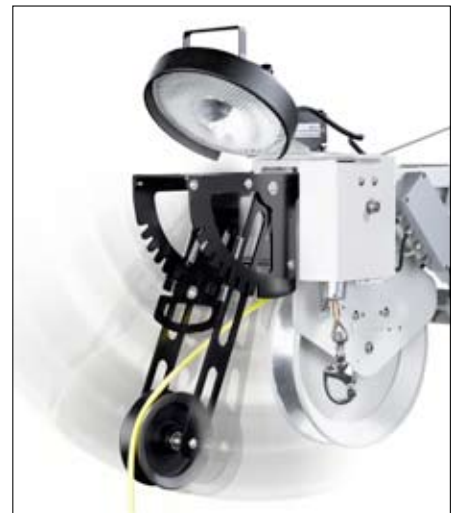
▲ IBAK KW 505, PANORAMO-SI-Positionierrolle